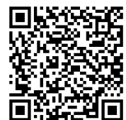
Instandhalter, Disponenten, Instruktoren