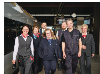
Unterschiedliche Bahnen – Gleiche Bedingungen Dafür steht die GDL.

Wir setzen uns für eine gute Aus- und Weiterbildung ein, denn nur so kann ein hohes Lohnniveau dauerhaft erzielt werden. Diese Aus- und Weiterbildungen und die notwendigen Prüfungsregularien müssen im Rahmen einer für alle Eisenbahnunternehmen bindenden Qualifizierungsverordnung einheitlich und verbindlich normiert werden.