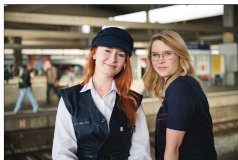
Die Eisenbahn in Deutschland hat Zukunft – wenn die Bedingungen für den Betrieb und zukünftiges Personal stimmen. Die GDL kämpft dafür!

Das Kerngeschäft, – die Eisenbahn in Deutschland –, muss wieder in den Vordergrund rücken. Beteiligungen mit deutschen Steuergebern in aller Welt müssen ein Ende haben.