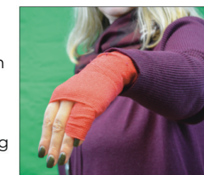
Übergriffe auf das Personal – hier muss zwingend die Sicherheit verbessert werden.

In der Verantwortung sieht die GDL auch die Arbeitgeber nach belastenden Ereignissen wie zum Beispiel Unfällen und Übergriffen. Sollten diese Fälle eintreten, hat die GDL erstmalig ein 16-Punkte-Konzept zur Betreuung des Personals erstellt.