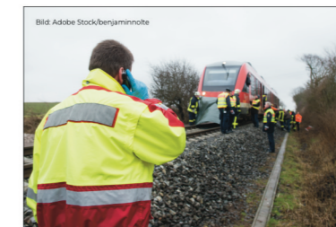
Bahnbetriebsunfälle sind leider Alltag. Deshalb muss die Betreuung und die Nachsorge für die Beteiligten verbessert werden.

Diesem Schwerpunkt- und Herzensthema widmen wir uns als GDL seit vielen Jahren.